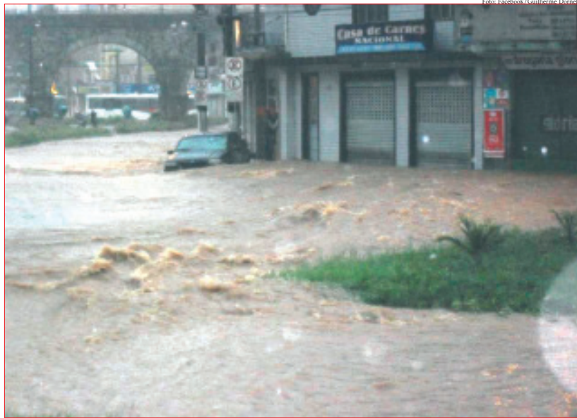
A água invadiu estabelecimentos comerciais e arrastou carros no bairro Pontilhão

A forte chuva que caiu em Barbacena na tarde do último domingo, dia 28, causou alagamentos e queda de barrancos em vários pontos da cidade. A Defesa Civil e o Corpo de Bombeiros foram acionados várias vezes para atender ocorrências de alagamentos, queda de muros, de árvores, deslizamentos de terra, entre outros problemas causados pela chuva. A tempestade durou cerca de 45 minutos e alagou completamente a parte baixa do bairro Pontilhão. A água chegou a encobrir o capô dos carros. Na rua Bahia o córrego transbordou e invadiu casas. Pág. 2